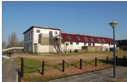
Stevenshoek 23 te Langweer: desolate indruk